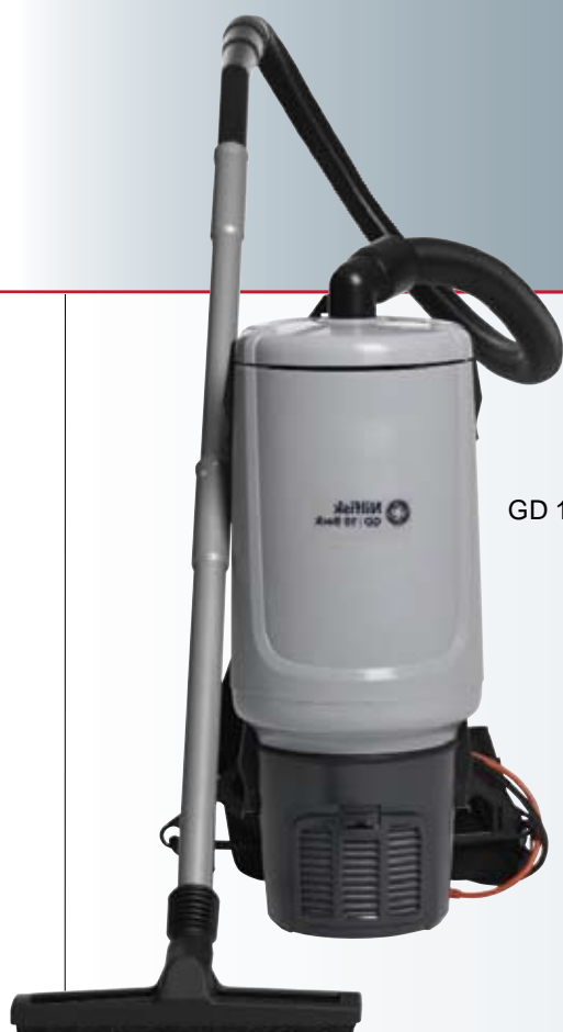
GD 10 Back

GD 5 /GD 10 背負い式クリーナーは他社製品を上回る性能を持ち、且つ、コストパフォーマンスに優れた製品です。