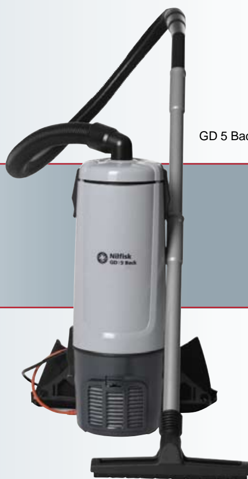
GD 5 Back